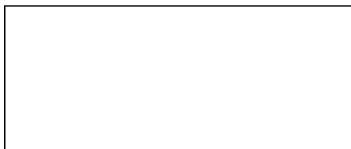
Fig.1 – Explicația imaginii

(se aliniaza in line with text, centrat, fara indentare, iar sub imagine se ofera explicatiile corespunzatoare si se numeroteaza. Este recomandat sa se indice sursa imaginii. Se va folosi font Times New Roman 10)